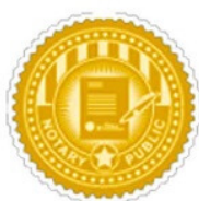
Apostilla de la haya

Ahora, el alumno/a tiene la opción de poder incluir en el diploma , realizado con nosotros, el reconocimiento internacional de la Apostilla de la Haya . A través de ella, un país firmante del Convenio de la Haya reconoce la eficacia jurídica de un documento público emitido en otro país firmante de dicho Convenio.