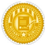
Apostilla de la haya

Ahora, el alumno/a tiene la opción de poder incluir en el diploma , realizado con nosotros, el reconocimiento internacional de la Apostilla de la Haya . A través de ella, un país firmante del Convenio de la Haya reconoce la eficacia jurídica de un documento público emitido en otro país firmante de dicho Convenio.